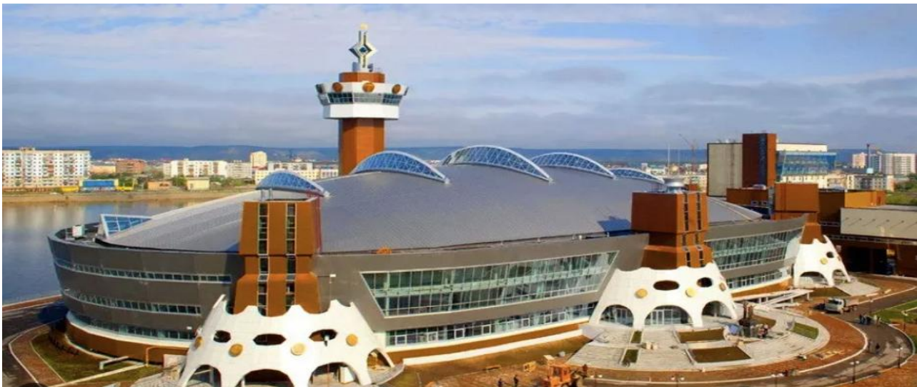
Рис. 6. Общий вид спортивного комплекса «Триумф» в г. Якутске

Кровля стадиона, который имеет овальную форму в плане, решена с пятью стеклянными зенитными проемами, обеспечивающими естественное освещение арены. Кровля опирается на уникальную большепролётную конструкцию пролётом 66 м. Зенитные фонари – необходимое решение для города, где 199 дней в году лежит снег и остро ощущается нехватка естественного света (рис. 6).