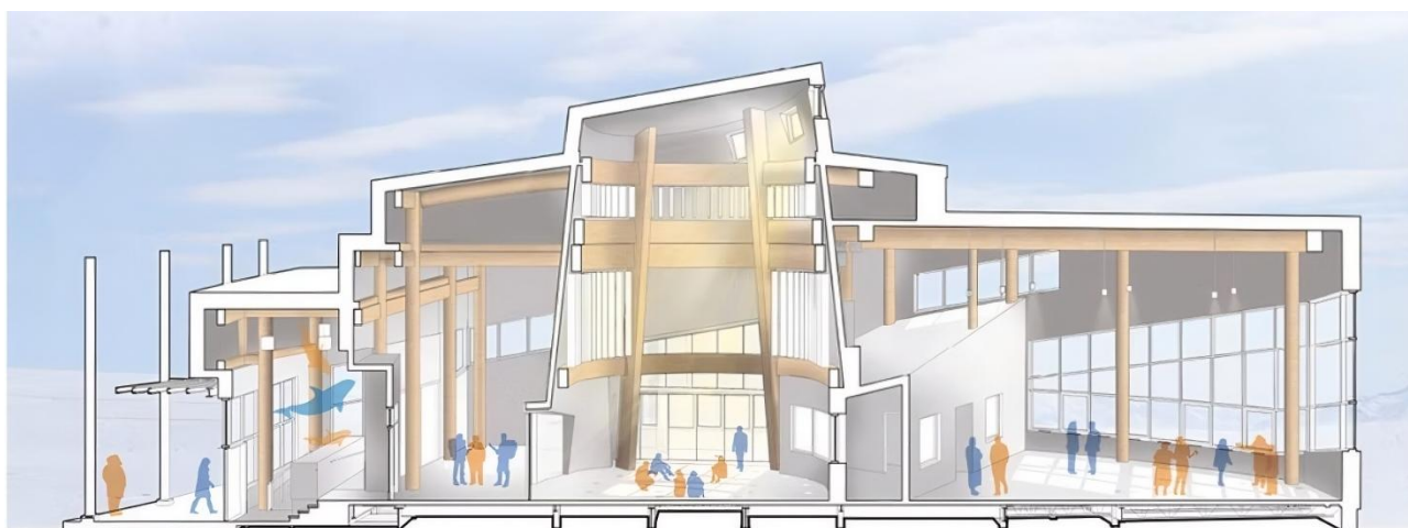
Рис. 5. Схема разреза национального арктического кампуса «Canadian High Arctic Research Station»