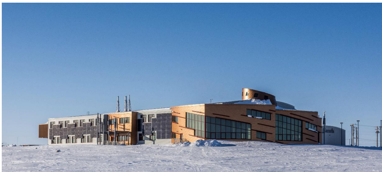
Рис. 3. Общий вид национального арктического кампуса «Canadian High Arctic Research Station»

Проект предварялся детальными исследованиями ветрового режима и снегонесущей способности потоков на участке: распределение корпусов и открытых пространств подчинено управлению снежными заносами. Линейный корпус установлен так, чтобы разрывать ветровой поток и одновременно формировать защищённые от ветра наружные зоны для работы и общественных мероприятий [12].