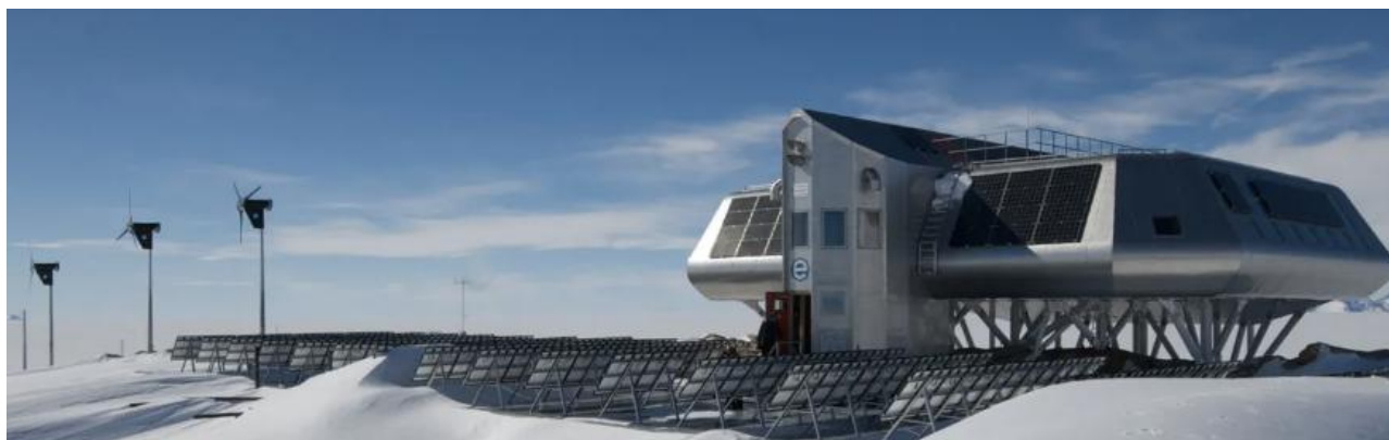
Рис. 1. Общий вид полярной научно-исследовательской станции «Princess Elisabeth Antarctica»

слуховых окнах; террасы используются для размещения метеорологических и аэрозольных приборов, требующих определённой высоты и коротких кабельных трасс. Также на кровле расположены термальные солнечные панели и часть фотоэлектрических панелей (рис. 1) [8].