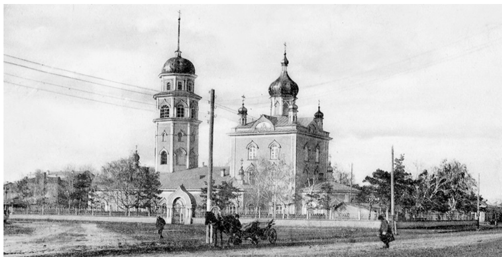
Рис. 2. Первое каменное сооружение г. Челябинска, символическое для данного периода. Собор Рождества Христова, строившийся с 1748 по 1766 гг.