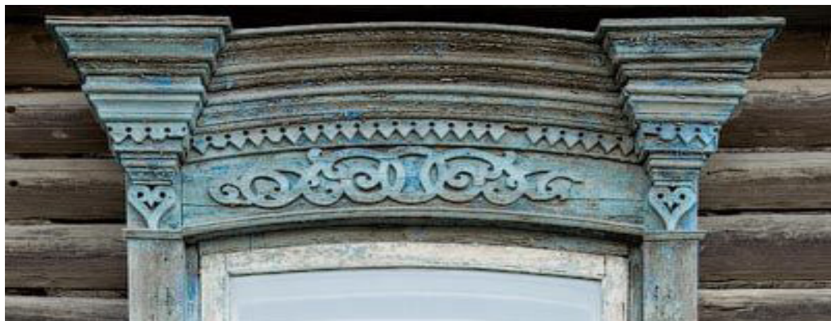
Рис. 1. Пример резного наличника с традиционными символами

Челябинска проходил шелковый путь, что особо повлияло на направление развития архитектуры в этой области. Это разнообразило русскую архитектуру 19 века. Собранный ансамбль из русской архитектуры и веяния орнаментов близ населенных народов Башкирии, Татарстана, некоторых северных народов сложили свой неповторимый стиль, удивительно многообразный и выразительный. Трактовки символов в разных регионах России могут быть совершенно разными, что связано с историей, последующим перениманием и адаптацией [к] собственной культуре разными народами [2].