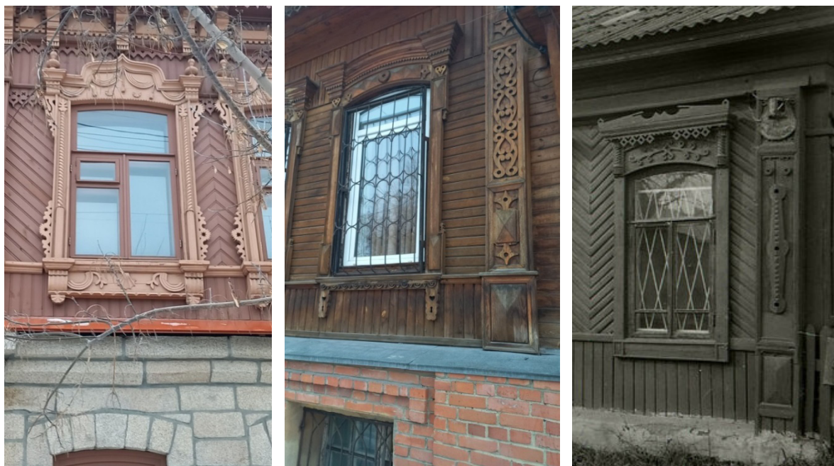
Рис. 3. Псевдостили в дизайне деревянных украшений жилых домов

полняются религиозными знаками. Знаки-обереги также прошли огромный эволюционный путь от примитивно-натуральной к условной форме, утвердившейся, в архитектуре барокко и классицизма. На первых каменных зданиях, символика имитирует символы деревянного зодчества, но значительно упрощается.