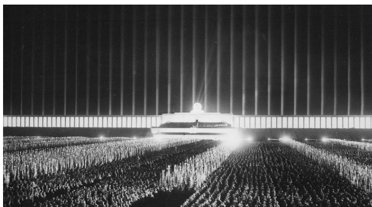
Рис. 4. Трибуна «Цепелин». Ночной вид. 1935 г., г. Нюрнберг, Германия