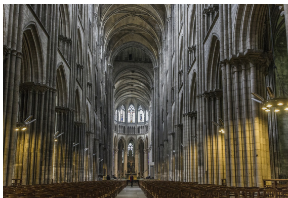
Рис. 2. Интерьер собора Сент-Урбан. 1262 г., г. Труа, Франция

начинается возрождение «униженной нации», возглавляемое национал-социалистами. После их прихода к власти в начале 30-х годов начинают появляться грандиозные архитектурные комплексы, призванные внушать немецкому народу чувство гордости за свою историю, призывая их к сплочению для достижения великих целей.