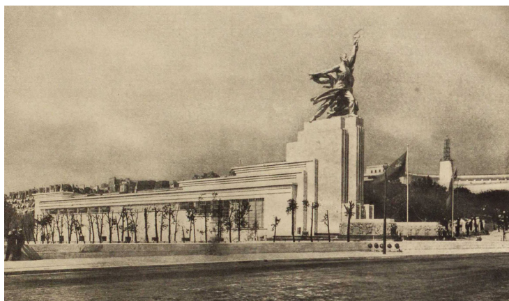
Рис. 5. Павильон СССР на Всемирной выставке. 1937 г., г. Париж, Франция