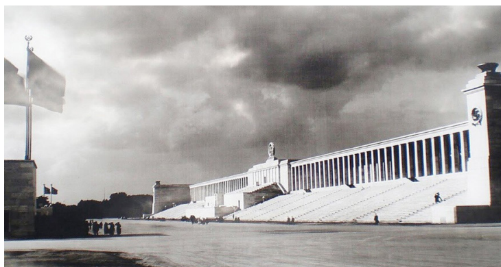
Рис. 3. Трибуна «Цепелин». 1935 г., г. Нюрнберг, Германия

Противовесом ей можно считать советскую архитектуру той эпохи (рис. 5). Общеизвестен факт, что на Всемирной выставке в г. Париже в 1935 году павильоны Германии и СССР располагались друг напротив друга [15, 16, 17, 18].