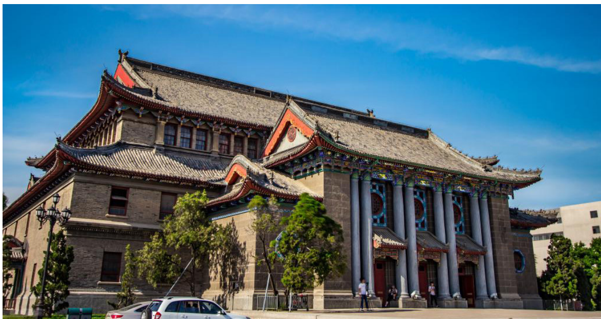
Рис.4. Архитектурный облик современного учебного корпуса Хэнаньского университета в г. Чжэнчжоу, Китай

Развитие древнегреческой цивилизации прошло через три основных периода: период древнеэгейской цивилизации, период древнегреческих городов-государств и период эллинистической цивилизации. Древнегреческая философия стремилась упорядочить движение с помощью стазиса, справиться с любыми изменениями с помощью отсут-