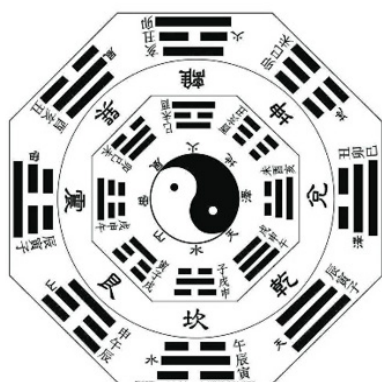
Рис.3. Китайский «Ицзин»

ствует концепция «небо круглое, земля квадратная», а «большая крыша» и «квадратный фундамент» в китайской архитектуре – это соответственное применение данной концепции. Под влиянием идеи конфуцианства о «ритуале» масштаб, размер, внешний вид, цвет, расположение, декор и другие аспекты китайской архитектуры имеют строгие огра-