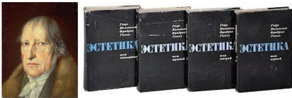
Рис.1. Г.В.Ф. Гегель и его четырехтомник «Эстетика»

ние на непрерывное развитие архитектуры, и изыскания ученых всего мира в области философии архитектуры продолжают до сих пор. Важность архитектурной философии для строительного проекта отражает то, что ученые со всего мира изучают этот вопрос, например китайские ученые Л. Вэй и Ф. Кай в соавторстве написали «Философию архитектуры», Ч. Сюэдун – «Теорию архитектурной философии» и т.д. [2].