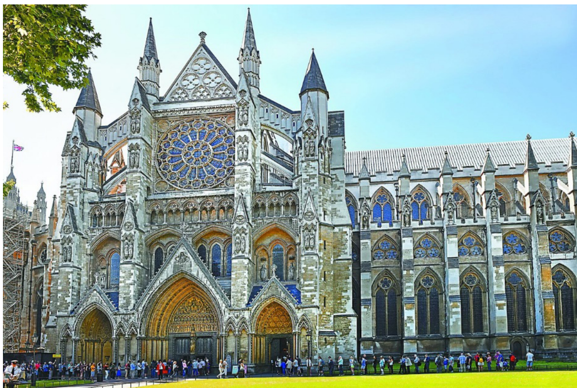
Рис.5. Готическая архитектура. Вестминстерское аббатство, Англия

Готический стиль, просуществовавший более четырехсот лет по всей Европе от Шотландии до Сицилии, оказал влияние на гражданские, религиозные, общественные и частные здания и даже на дух людей того времени (рис. 5).