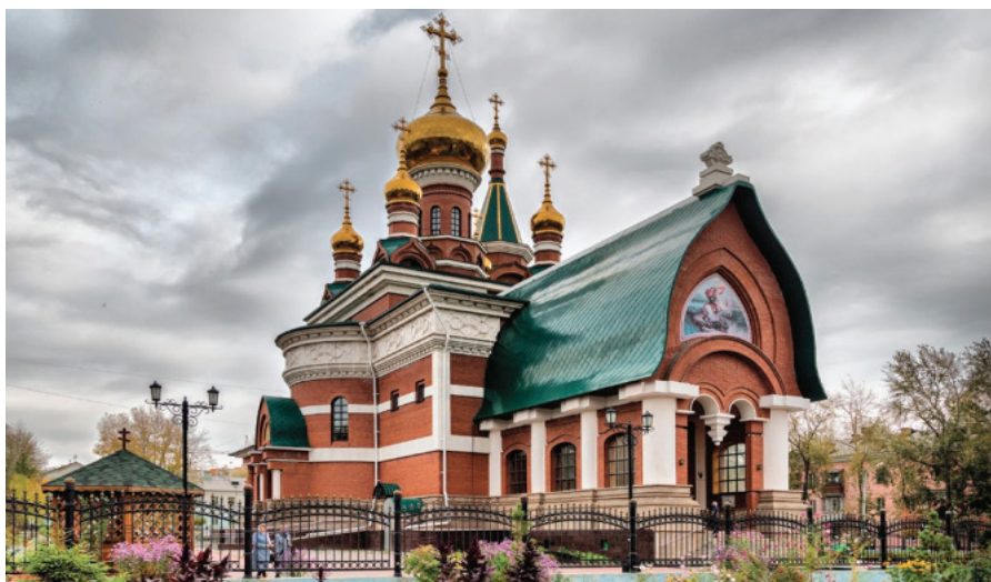
Рис. 1. Вид с северо-западной стороны Свято-Георгиевского Храма