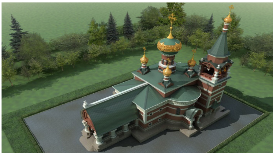
Рис. 2. Исходный вариант (компьютерная модель) главного купола Свято-Георгиевского Храма