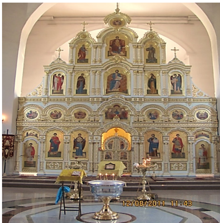
Рис. 4. Деревянный иконостас Свято-Георгиевского Храма

имеет единое пространство, в котором отсутствуют колонны. Стены на высоте двух метров от пола отделаны однотонным гранитом. Пол также облицован и имеет красивый мозаичный геометрический рисунок, изображающий круг. Около центра этого круга стоит аналой с праздничной иконой. Это создает особую правильность и красоту всему интерьеру храма. Торжественность интерьеру придает красивейший иконостас (рис. 4), изготовленный в Омской иконостасной мастерской. Согласно плану, он изготовлен вручную из липы и кедра, а также покрыт сусальным золотом. Омские мастера написали великолепные иконы с приятным мягким колоритом. По просьбе настоятеля храма, отца Владимира Воскресенского, иконы выполнены в византийском стиле - в стиле полеологовского Ренессанса. Форма иконостаса треугольная. В высоту он достигает 11,5 м, а на нём размещены более 30 икон в нескольких ярусах. Расположение икон и их назначение строго регламентируется церковными канонами, которые являются основой для создания этих священных изображений. Эти каноны тщательно разработаны и передаются из поколения в поколение, чтобы сохранить традиции и духовную суть православия. Исследователи отмечали, что иконостас, имеющий несколько рядов, в описях нередко назывался «деисусом» [12-19]. Метонимия