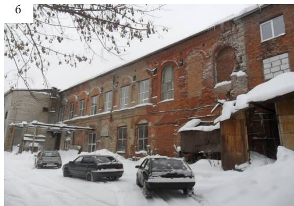
Рис.5. Фото автора отделочного корпуса: а – западный фасад центральной части, 2022 г.; б – стена котельной, 2022 г.

ке суховатым декором в духе готизирующей эклектики.