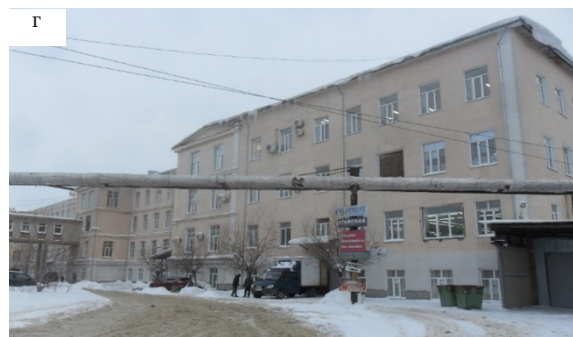
Рис. 3. Виды с юга пряядильного корпуса: а – фото 1896 г.; б – с сохранившейся гринельной башней; в – фото авто-ра 2010 г.; г – с оштукатуренными фасадами, фото автора, 2022 г.

окрашено в нехарактерный для промышленного зодчества персиковый цвет, утерян дымник на кровле. Ныне в здании расположены швейные цеха.