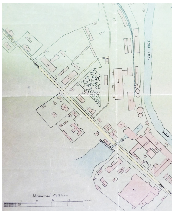
Рис. 2. Генеральный план Большого Кохомского товарищества мануфактур. Архивный чертеж 1926 г. ГАИО [1]

На втором участке (по другую сторону ул. Ивановской) расположено одноэтажное здание ткацкой фабрики конца 1890-х гг., а с северо-восточной стороны распо-