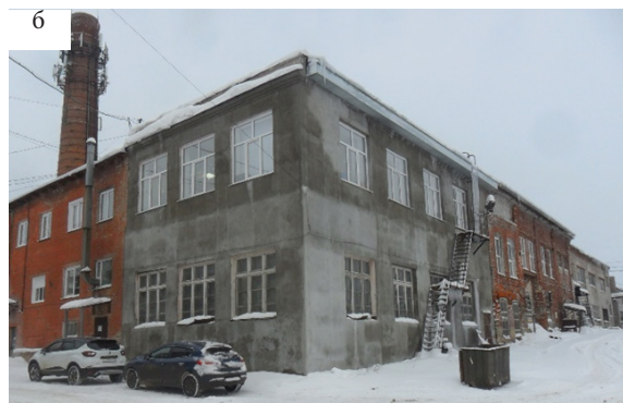
Рис. 4. Электростанция: а – архивное фото начала XX века [3]; б – современное состояние, фото автора, 2022 г.