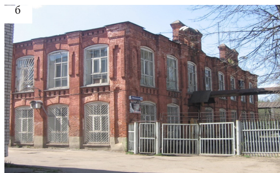
Рис. 7. Общие виды: а – ситцепечатной фабрики; б – административного блока здания механических мастерских, фото автора 2010 г.

ного для центральной России исторического промышленного предприятия – Кохомского хлопчатобумажного комбината – показал, что она во многом фрагментарна. Объемы производственных корпусов как материальные структуры остаются в основном в сохранности, но они искажаются немасштабными пристройками, надстройками, теряют «ненужные» предпринимателям блоки, высотные акценты. Вместе с тем архитектурно-композиционное, а особенно декоративное их решение часто подвергается упрощению, утратам мелких пластических элементов, аутентичной фактуры. В то же время объекты социальной инфраструктуры предприятий находятся в лучшей степени сохранности.