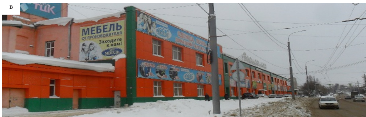
Рис. 6. Ткацкий корпус: а – дореволюционное фото [3]; б – фото 1980-х гг. из архива комитета Ивановской области по государственной охране объектов культурного наследия; в – современный фасад, фото автора, 2022 г.

Здание прядильного корпуса представляет собой основной вытянутый объем 1890 г. постройки с позднейшими пристройками, размерами 143×38 м с несколькими производственными залами, разделенными коридорами технического и вспомогательного назначения. Фасады сооружения, с рядами часто расставленных окон с лучковыми перемычками, расчленены тонкими междуэтажными карнизами, украшенными рядами мелких сужающихся книзу зубчиков. Завершающий стены широкий фриз имеет оригинальный выложенный из кирпича орнамент