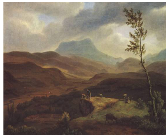
Рис. 3. Жан-Кристоф Мивилль. Вид на гору Чатыр-Даг