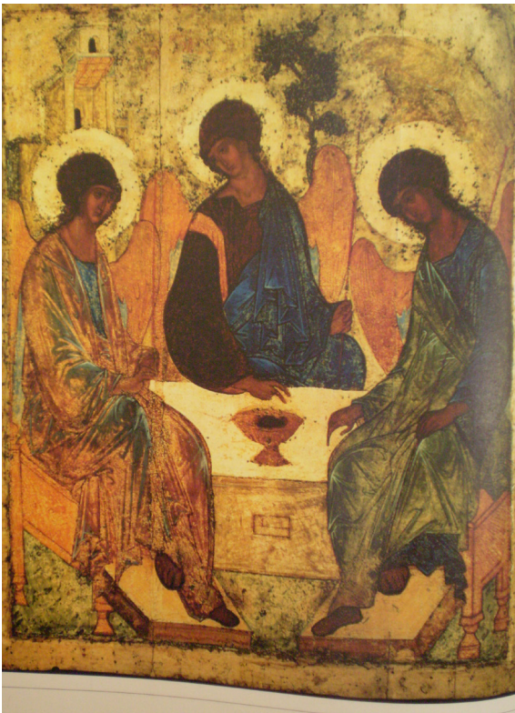
Рис. 4. А. Рублев. Троица. Икона XV в.