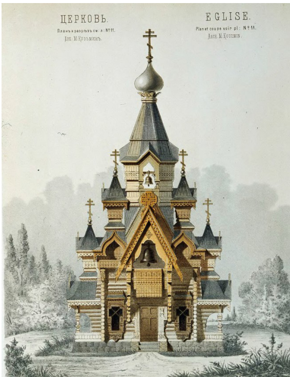
Рис. 1. Отмывка фасада церкви. Архитектор М. Кузьмин

необходимо для создания изобразительной аналогии реальной среды, окружающей архитектурный объект.