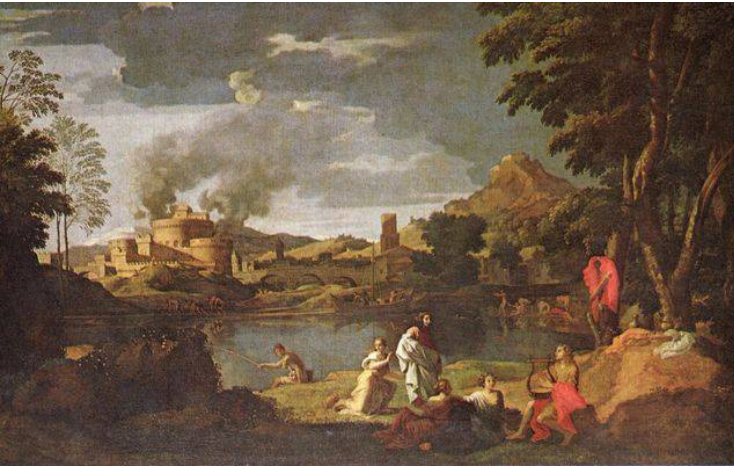
Рис. 8. Н. Пуссен. Орфей и Эвридика