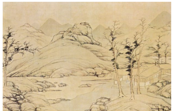
Рис. 7. Ли Чжу. Весенний речной пейзаж