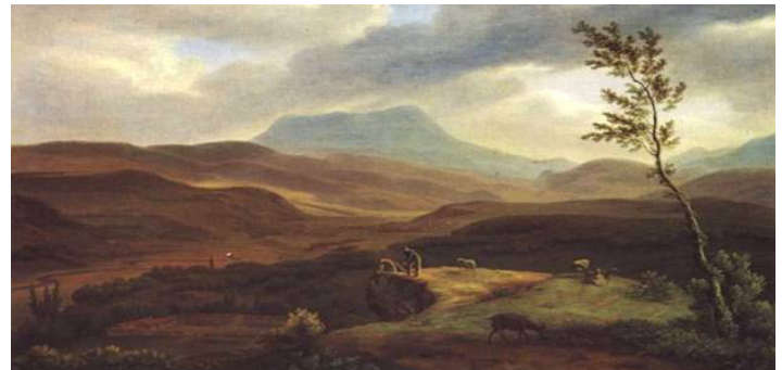
Рис. 11. Жан-Кристоф Мивилль. Вид на гору Чатыр-Даг