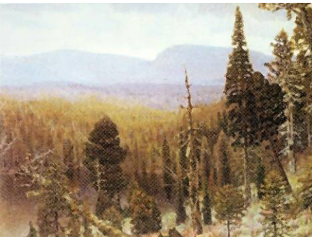
Рис. 10. Васнецов А. М. Тайга на Урале. Синяя Гора