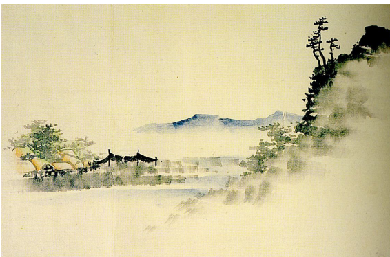
Рис. 6. Кацусика Хokusай

одиночку. Картина дали, дымкою накрыта, утес глубокий – в туче, как в замке. Когда рисуешь беззаботность туч, то не давай клубиться им грибом узорным чжи. .. Далеким горам не могут с ближайшими слиться горами. Далеким водам не могут с ближайшею слиться водой. Где нет дороги, там пусть роица и леса... Когда рисуются деревья чащ лесных, далеким редки и ровны, а близким часты и высоки. Коль есть на них листва, то ветвь нежна, мягка; коль листв нет, – упруга и сильна. Коль на земле растет, то корень длинный, ствол прямой; на камне ж – скрючена в кулак и одинока. Нельзя давать деревья без числа: важнее показать, как стройны, милы горы. Нельзя нарисовать и горы кое-как: а надо выявить здоровый рост дерев. Картину, где подобное, воз-