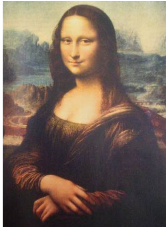
Рис. 5. Леонардо Да Винчи. Джоконда. XVI в.

Пейзажи китайских художников очень одухотворены и поэтичны (рис. 6, 7). Они как бы вбирают в себя представления о необъятности и безбрежности мира природы. Интересно описание приемов живописной работы над пейзажем в трактате «Тайны живописи» Ван Вей: «...Средь путей живописца тушь простая выше всего. Весна или лето, осень, зима рождаются прямо под кистью. Хозяину-пику лучше всего быть высокоторчащим; гости же горы нужно, чтоб мчались к нему. . . Далеким горам нужно снижать и раскладывать; близким же рощам надо скорее дать вынырнуть резко... Горе иль обрыву дай водную ленту: пусть брызжет и мчится... Однако потоку не следует течь как попало. У рта переправы должно быть лишь тихо и пусто; идущие люди пусть будут редки, в