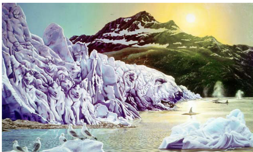
Рис. 12. Boris Vallejo

Совершенствуя свою изобразительную культуру, студент учится образно и пространственно мыслить, что отражается и в критериях оценки проекта: образное соответствие отмывки характеру архитектурного сооружения; грамотное изображение фасада в окружающей среде; грамотное построение чертежа и теней, композиция чертежа, графическое мастерство тонового моделирования крупной архитектурной формы.