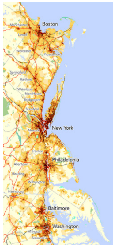
Рис. 2. Мегалополис Босваш, США (от Бостона до Вашингтона)

Босваш – сплошная городская застройка протяженностью свыше 1000 км и шириной местами до 200 км вдоль Атлантического побережья США – связанные между собой агломерации Бостона, Нью-Йорка, Филадельфии, Балтимора, Вашингтона. На территории всего 3% территории страны проживает 45 млн человек, или 15% населения США.