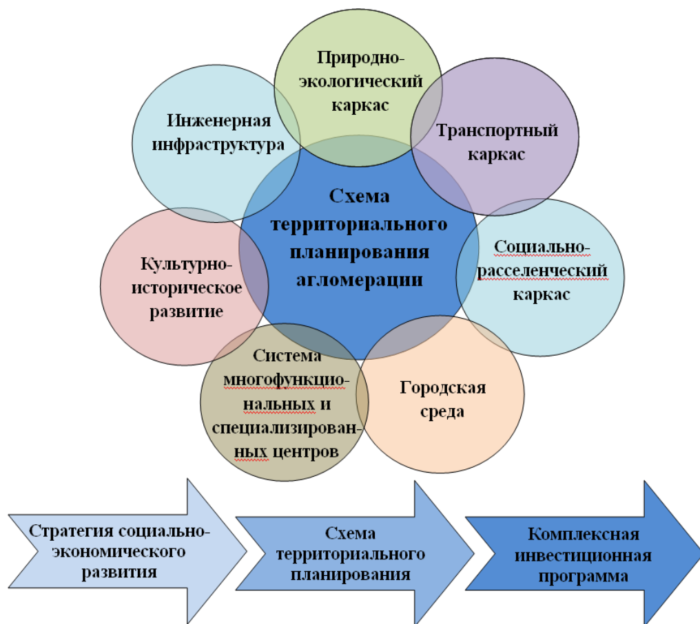
Рис. 3. Основные задачи территориального развития агломераций

Во-вторых, если модель сконцентрирует большую часть управленческих функций на региональном уровне власти, то это может привести к заметному противодействию муниципальных образований в реализации данной схемы.