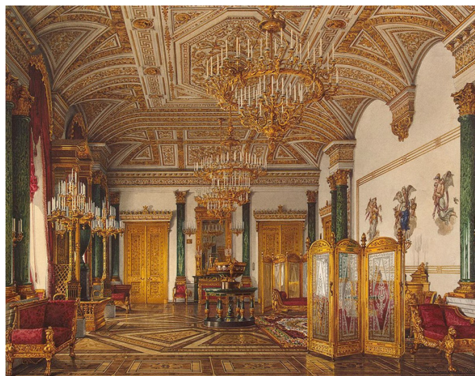
Рис.1. Малахитовый зал в Зимнем Дворце, Санкт-Петербург, Россия