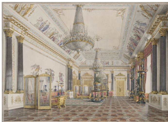
Рис.3. Золотая (Яшмовая) гостиная в Зимнем дворце, Россия

искусства мозаики уходит в глубокую древность. Довольно неизвестно, как и где она появилась, но уже 4 тысячи лет назад в древних шумерских городах мозаичные фрагменты использовались для украшения храмов и дворцов. В античные времена рас-