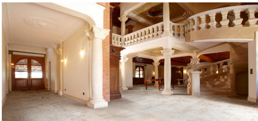
Рис.2. Использование травертина в интерьере

пояс, полосой в 40-50 километров протягивается почти на 500 километров от Миасса до Мугоджарских гор. Вдоль почтового тракта Миасс – Верхнеуральск – Орск местное население и путешественники-исследователи наталкивались на отдельные глыбы этого камня. Кошкульдинская яшма – царица уральских ленточных яشم. Яшма, в которой буровато-красные полосы перемежаются с серовато-зелеными, создавая красивые ленточные рисунки. Она использовалась для украшения Тронного зала и Яшмовой гостиной строящегося Зимнего дворца в Санкт-Петербурге (рис.3).